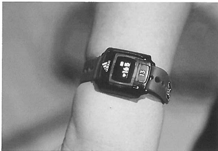
Les montres utilisées donnent le rythme cardiaque et changent de couleur selon l'effort fourni.

Les jeunes ont embarqué. Pas tous au début, reconnaît M. Kerr, mais les récalcitrants ont été vite motivés par l'attrait de l'outil électronique hi-tech, fabriqué