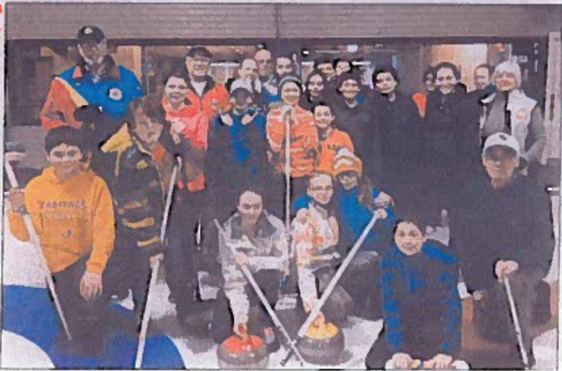
Sunnyside's grade five students and their volunteer curling instructors at the Border Curling Club.