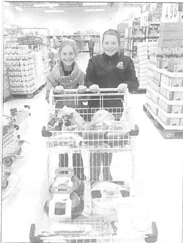
Two grade 6 students shopping at Maxi to prepare snacks for the snack table