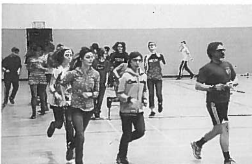
Les élèves de 1 er secondaire du secteur anglophone de l'école Massey-Vanier se prêtent à des entraînements supervisés électroniquement afin d'améliorer leur santé, leur comportement et leurs résultats scolaires.