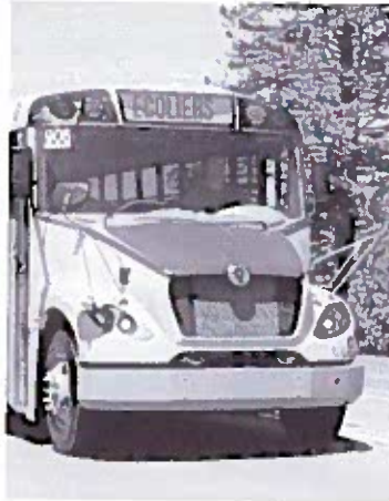
L'autobus scolaire eLion, 100 % électrique, est conçu à Saint-Jérôme.