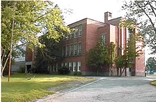
École primaire St-Francis

Heures d'enseignement : 8 h 45 à 15 h 00